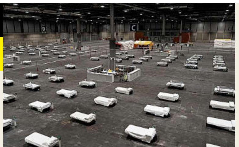
Hospital de campaña instalado en Ifema.

Aquello cambió Barcelona y todo el país y desde entonces, nuestra ciudad se convirtió en destino preferido de millones de ciudadanos de todo el planeta. Aquello proporcionó prosperidad no sólo para Barcelona, sino también para Cataluña y España. Lo conseguimos unidos, anteponiendo el interés común al partidista, todos a una. Casi 100.000 voluntarios y así conseguimos los mejores Juegos de la historia. Pues ahora nos encontramos ante otra crisis de dimensiones desconocidas. La solidaridad y voluntariado ha vuelto a aparecer con la tris-