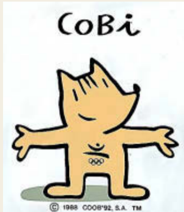
Cobi, mascota de Barcelona 92.

Esto me recuerda salvando las diferencias, al sueño de Barcelona para organizar unos Juegos Olímpicos . Lo habíamos intentado en cinco ocasiones y siempre nos habíamos quedado con la miel en los labios. Barcelona era a principios de los 80 una ciudad triste, gris, anodina sin ilusión y que vivía también los avatares e impactos de la llamada crisis del petróleo. Hacía sólo 5 años que vivíamos en democracia y el entonces alcalde Narcis Serra tuvo la audacia de convencer al consistorio barcelonés para presentar