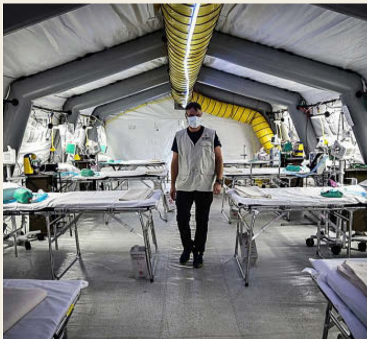
Hospital de campaña en Italia.

Todo esto que sucede debería hacernos meditar. Estamos recibiendo una tremenda lección de humildad. Ni fronteras, ni ideologías, ni sistemas políticos. A pesar de que algunos, quizás atenzados por el miedo, asustados por el pánico que está produciendo esta pandemia y los menos, demostrando que la estupidez humana no tiene límites, utilizan esta situación de catástrofe en beneficio propio, criticando y tratando de arriar el ascua a su sardina. Qué fácil es criticar y qué difícil es construir. Ahí está la diferencia y es el objetivo de esta carta hijo. A pesar de todo, hay miles y miles de personas que arriesgan sus vidas para atender a los más enfermos y muchos otros