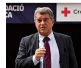
Joan Laporta (59).