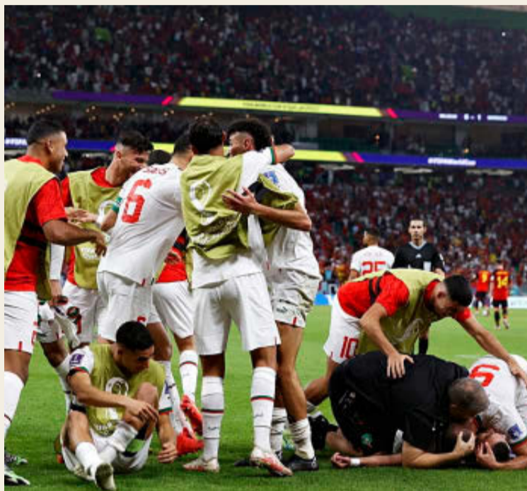
Los jugadores de Marruecos celebran el triunfo sobre Bélgica.

o casi invisibles como Arabia Saudí o Costa Rica, entre otros que han peleado hasta el último minuto. Hay que reivindicar la revolución de los mal llamados modestos y me gustaría destacar a equipos jóvenes, quizás ingenuos, como Canadá que creo que les espera un gran futuro. Otro aspecto importante a resaltar es el mestizaje de muchas selecciones y también el cambio generacional. Destaque los cuántos países cuentan entre sus filas con jugadores emigrantes, hijos de emigrantes o ciudadanos de antiguas colonias que son en muchos casos la base de sus selecciones, factor muy importante y relevante social y deportivamente hablando. Y cómo no, la caída de algunos grandes como Alemania y Bélgica, algo impensable. A mí, y seguramente puede ser una