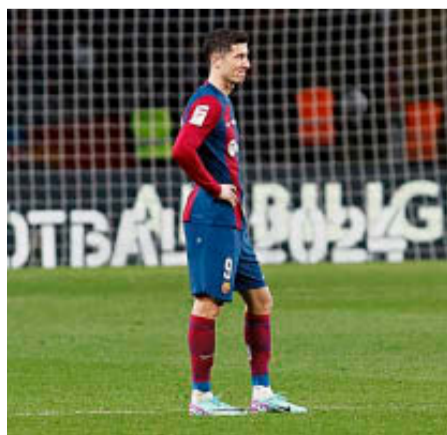
Lewandowski (35), pensativo.