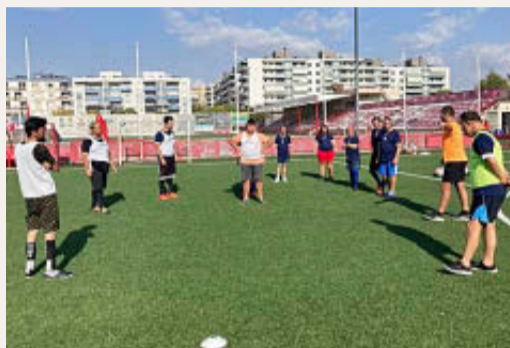
El Atlètic Lleida Genuine, en una sessió.