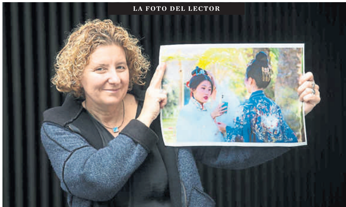
LA FOTO DEL LECTOR

He viajado a El Cairo y he percibido la tensión y extrema seguridad que vive la ciudad por las negociaciones entre Israel y Hamas. Viene al caso para exponer la gran paradoja que vivimos. El mundo occidental, pequeña parte del planeta, está volcado en la sostenibilidad, tratando de identificar problemas que, si se trasladan al resto mayoritario de la humanidad,