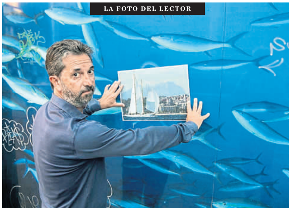
LA FOTO DEL LECTOR

Cada vez es más común que las mutuas atribuyan lesiones a problemas de desgaste para evadir su responsabilidad y costes, incluso realizando diagnósticos superficiales o erróneos, lo que deja al trabajador indefenso ante la pérdida de su derecho a una atención médica acorde y el reconocimiento de un accidente laboral. Se debería poner fin a esta